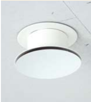
Zuluftventil in der Decke