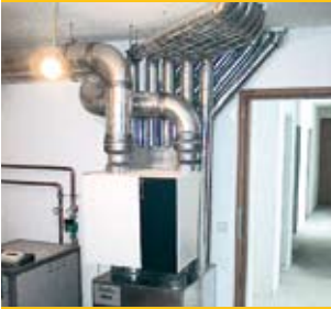
Lüftungsgerät im Keller