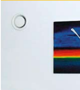
Abluftventil in der Küche