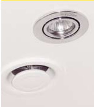
Zuluftventil im Bad