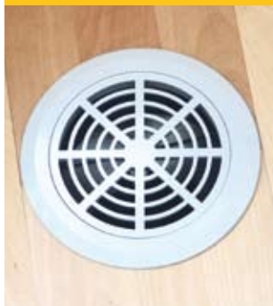
Zuluftventil im Fußboden